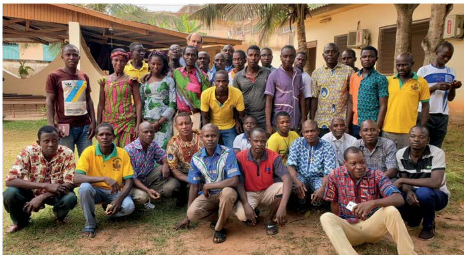
Skupina katehistov na tečaju

Slonokoščena obala je ekonomsko dobro stoječa država. Po osamosvojitvi leta 1960 so imeli karizmatičnega predsednika Félix Boignyja, ki