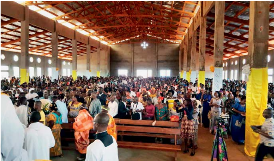
Nedeljsko bogoslužje v stolnici

je s trdo roko pa vendar modro vodil državo in postavil temelje za današnji razvoj. Vladal je več kot 30 let ter v tem času razvil šolstvo in zdravstveno oskrbo na zelo visoko raven. Država ima ogromno naravnih virov, tudi petrolej. Na žalost pa to bogastvo ne služi vsem ljudem.