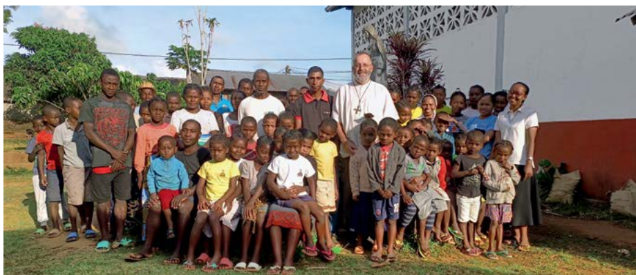
Večerni rožni venec

No, in papež nam v teh razmerah govori o gostiji. O gostiji, ki nam jo pripravlja nebeški Oče in na katero smo vsi povabljeni. Sam sem to bogoslužje Misijonske nedelje globoko doživel in z veseljem ter upanjem smo se okoli 2h popoldne poslovili. Ko takole hodim iz nedelje v nedeljo po naših podružnicah in obiskujem oddaljene vernike, sem Bogu hvaležen za teh 25 let, prihodnost pa popolnoma izročam v Njegove roke.