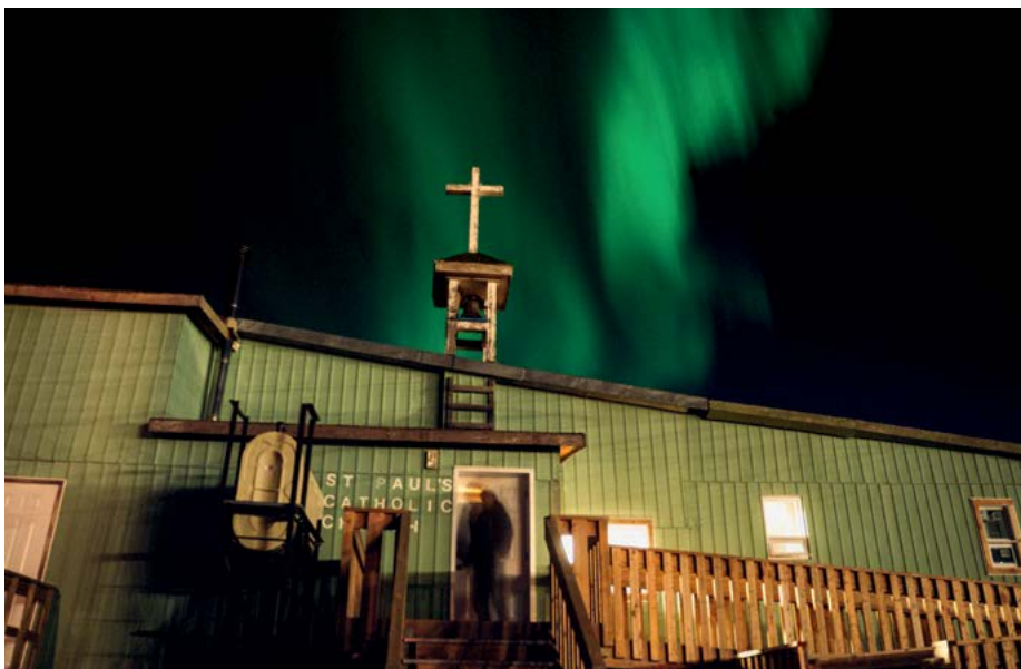
Pogosto viden severni sij