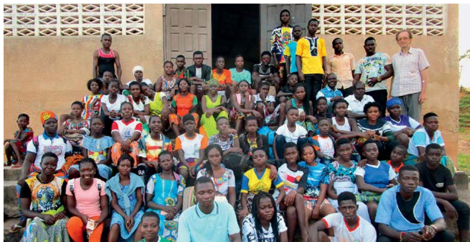
Na Slonokoščeni obali so krščanska občestva številčna.

je ostal do leta 2015. Trije duhovniki koprške škofije na Slonokoščeni obali so bili velika pomoč domači Cerkvi. Leta 2018 je šel še enkrat v misijone in se leta 2019 zaradi zdravja dokončno vrnil v domovino. Po vrnitvi je bil sprva župnik, od leta 2022 pa je duhovni pomočnik v župniji Opatje selo.