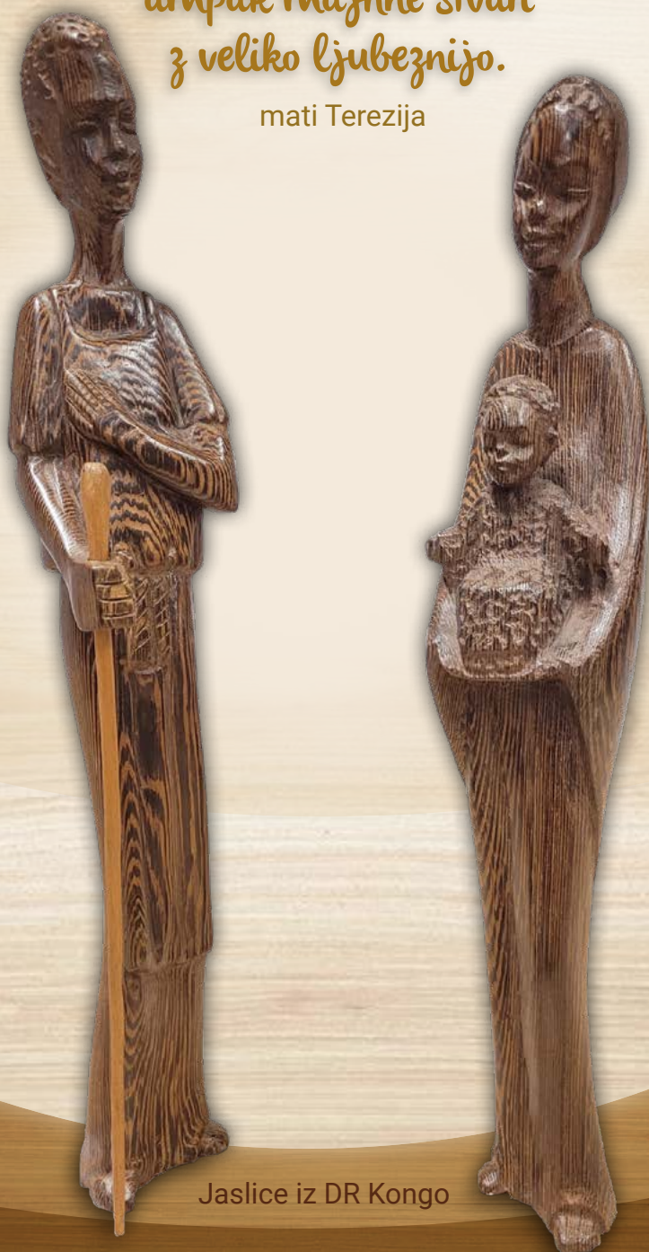
Jaslíce iz DR Kongo