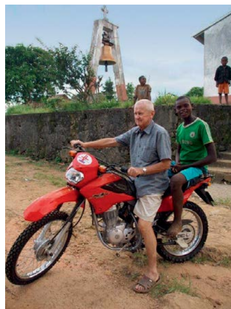
Motor je na Madagaskarju zelo priročno prevozno sredstvo.