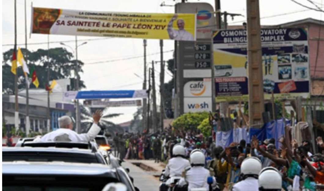
● Papež je ob vsaki priložnosti odprl okno in pokazal bližino ljudem, Kamerun, Foto ©VaticanMedia