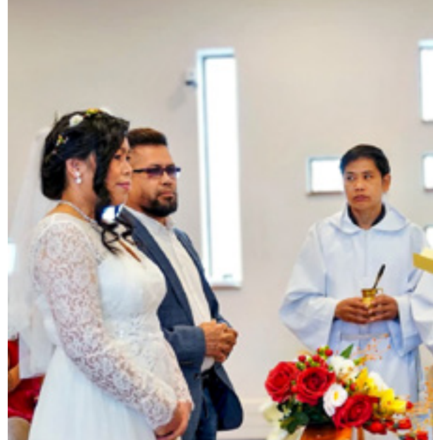
● Poroke , znamenje upanja.