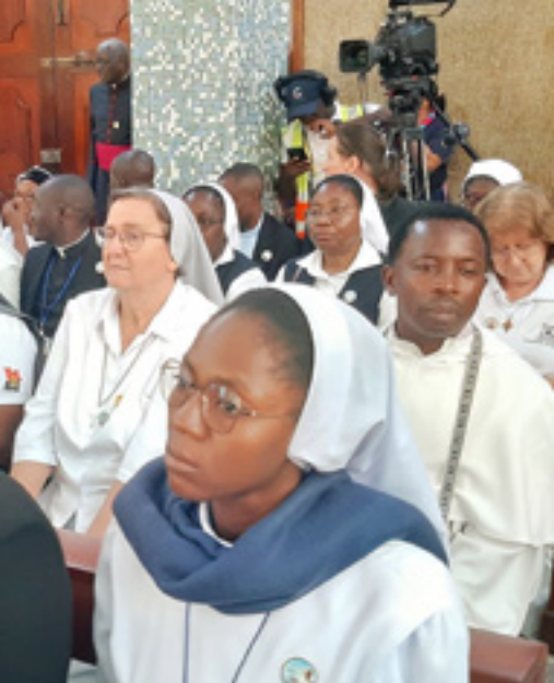
● S. Zvonka na srečanju redovnikov s papežem