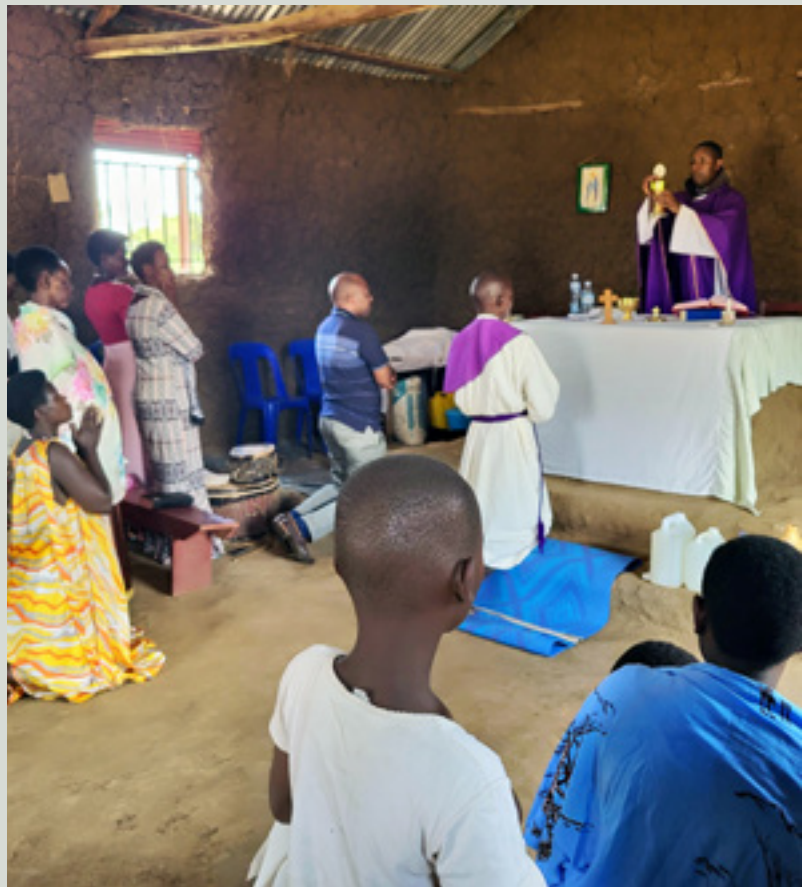
● Sveta maša na podružnici-Uganda

Cerkev pa se gradi iz živih kamnov. Mala občestva so rasla po domovih, ko so začeli z evangelizacijo apostoli. Šele v srednjem veku je triumfalistični duh prevzel krščanske vrste. Danes se vračamo v prakrščansko miselnost. Življenje krščanskih občin postaja važno, ne več kamen in marmor. Tudi v krščanskih deželah nastajajo manjše, skromnejše cerkve, a te bolj pogosto posejane. Še bolj za misijonske dežele zagovarjajo to