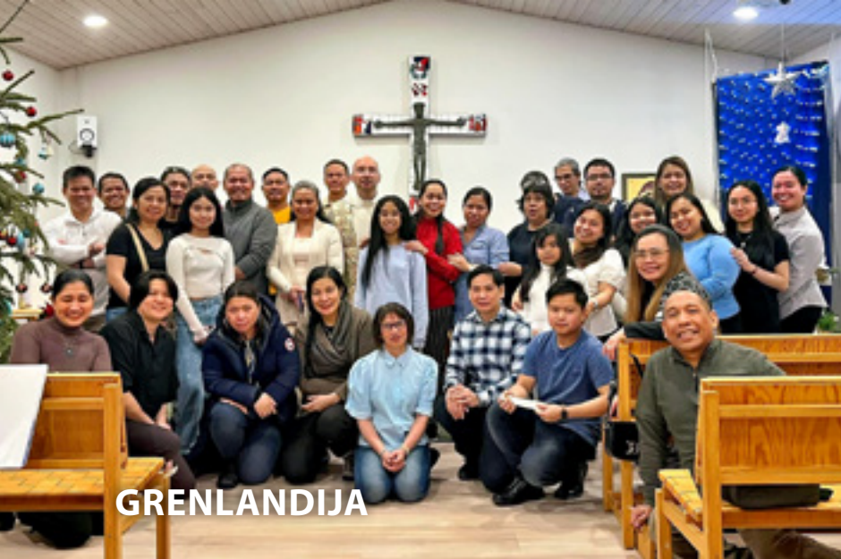
● Majhna , a živahna skupnost v Nuuku