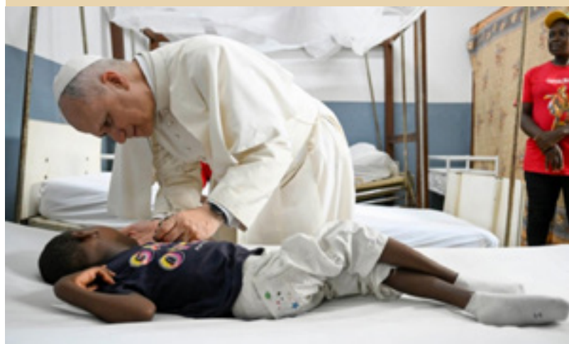
● Papeževa pozornost do otrok in trpečih, Kamerun, Foto ©VaticanMedia

»Obisk papeža Leona XIV. je bil osredotočen na mir, spravo in mladino. V svojih nagovorih je neposredno pozival k miru, pravičnosti in koncu korupcije. Zagovarjal je mir brez orožja, boljšo vključenost mladih in žensk ter opisal raznolikost države kot zaklad in ne kot šibkost. V Bamendi na severozahodu države je papež Leon XIV. odločno obsodil nasilje, pozval k njegovemu koncu ter k spravi. V Douali pa je mlade, ki jih je imenoval "upanje Kameruna", spodbudil, naj ne popustijo obupu, naj se izobražujejo in postanejo akterji miru.« ●