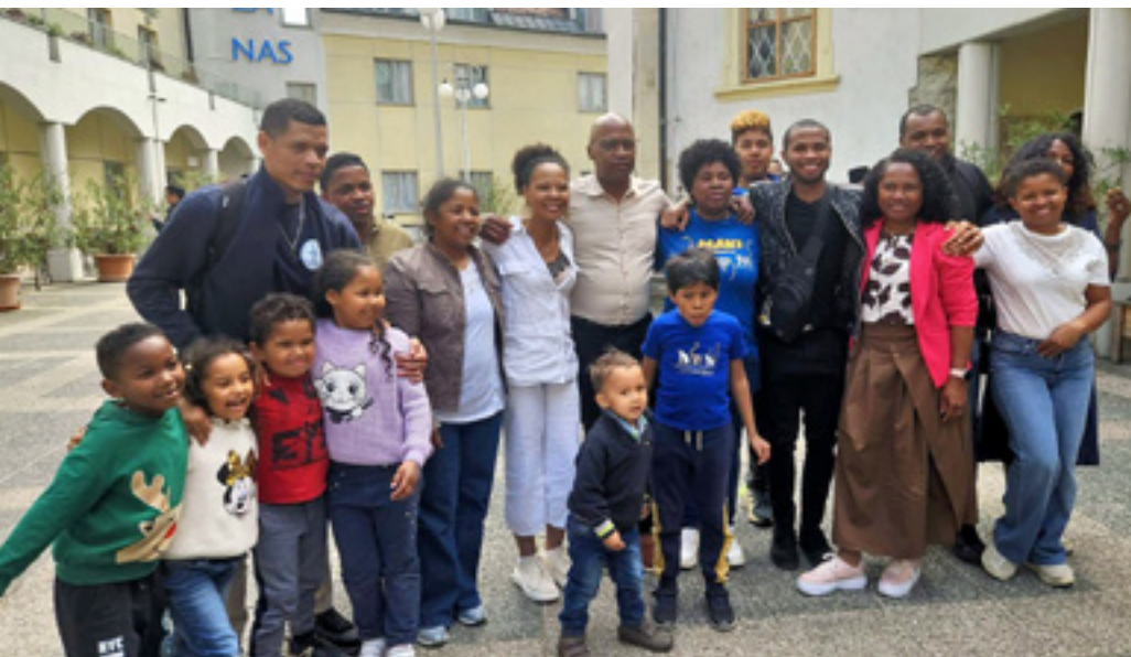
● Srečanje Malgašev v Celju

Nekoč je živel kraljevič, ki je imel vse. Nekega dne si je zaželel, da bi za en dan postal berač in videl svet z drugačnimi očmi. Rečeno storjeno. Naslednji dan kraljevič, preoblečen v berača, sreča še enega berača in z njim preživi cel dan, vse do poznega večera, ko se odpravita spat v skedenj. Kraljevič je počakal, da je sotrpin zaspal, nato pa mu je v malho dal biser in sredi noči odšel nazaj v grad. Čez mnogo let se kraljevič, ki je medtem postal kralj, sreča s tem istim beračem. Pristopil je do njega in mu rekel: "Kako si