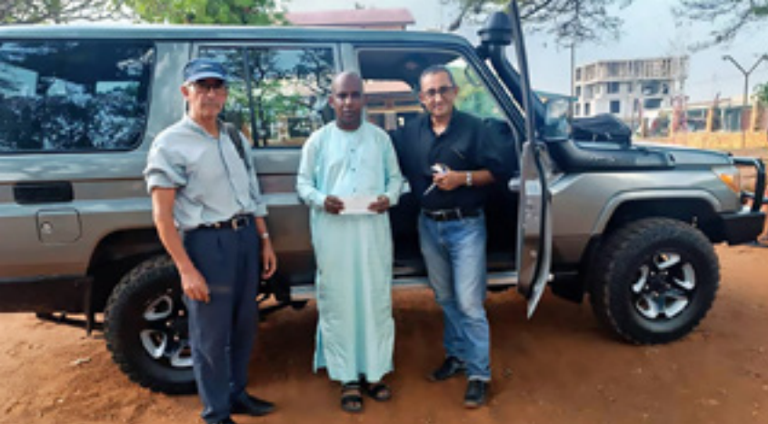
● Centralno afriška republika

Olajšata nam poti k tistim plemenom, ki so izrinjena iz socialne družbe. Z darovi MIVA ste poskrbeli, da do njih pride tudi humanitarna pomoč v obliki hrane in šolskih potrebščin. Misijonarkam pa omogočata bolj pogosto navzočnost med plemeni, željnimi Boga in resnice. Velik bog plačaj iz srca prav vsakemu darovalcu.